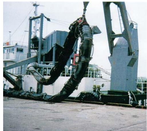
吊り上げ式 Hanging Type